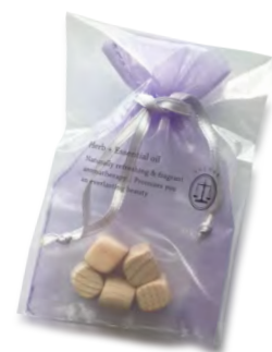
ヒノキキューブサシェ

（ヒノキキューブに抗菌効果のあるティーツリーのオイルを染み込ませているので、靴の中や靴下の収納に入れると効果的です。）